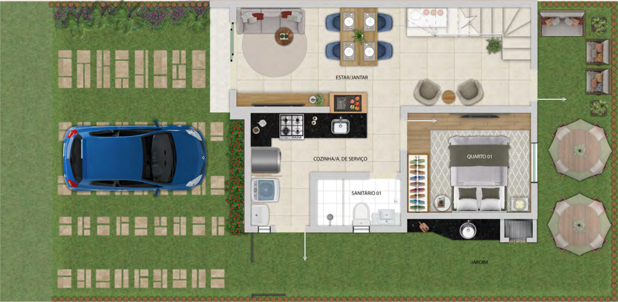
4 QUARTOS (1 SUÍTE) | ÁREA GOURMET EXTERNA | 2 VAGAS DE ESTACIONAMENTO