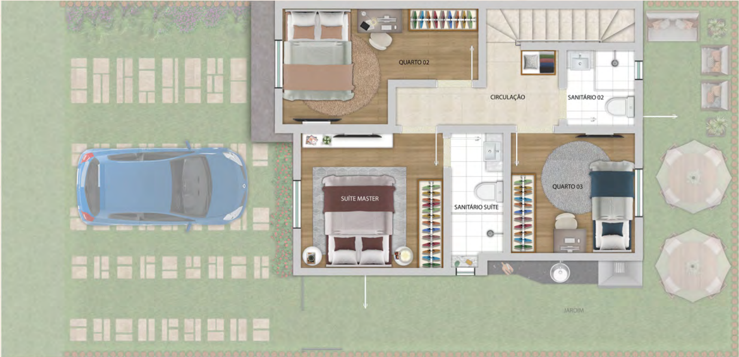
Dois pavimentos com muito conforto e espaço para toda a família! O quarto no térreo garante a acessibilidade e possibilita a criação de um novo cômodo, de acordo com a sua necessidade.